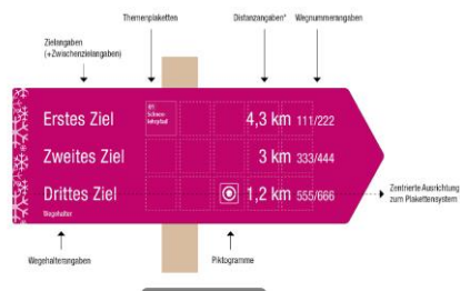
Darstellung bei bedruckten Schildern mit Schneesternmatrix